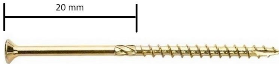
Obrázek 1: Vrut 4x60 pro pověšení hodin

Po ukončení životnosti rozdělíte různorodé materiály hodin a předejte samostatně k recyklaci.